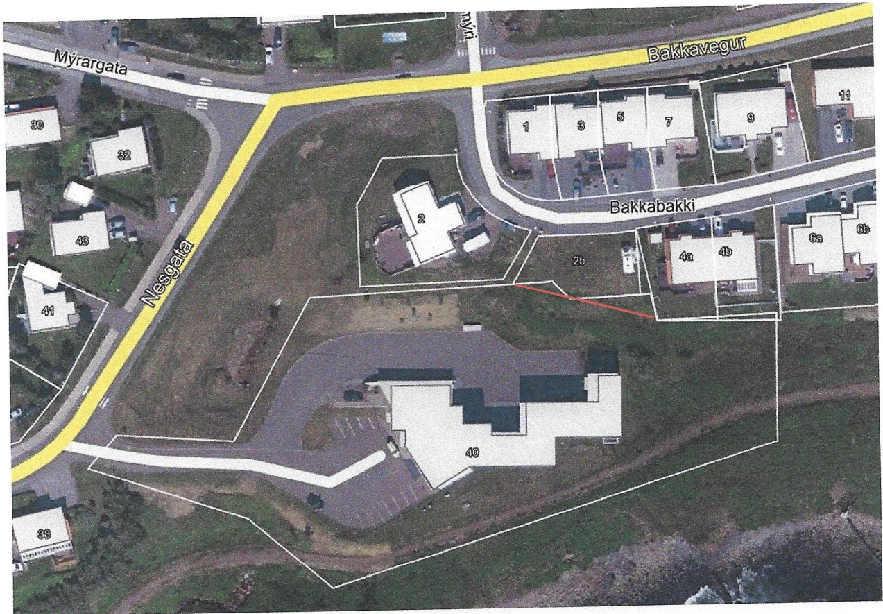
Mynd 1 Lóð VA Nesgötu 40 og Bakkabakka 2b. Tillaga að minnkun lóðar VA er sýnd með rauðri línu.