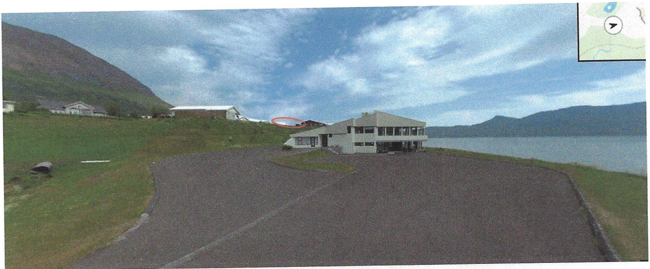
Mynd 2. Séð í austur, eftir lóð VA Nesgötu 40 að Bakkabakka 2b. Rauður hringur táknar svæði sem óskað er eftir að Ríkissjóður Íslands gefi eftir.