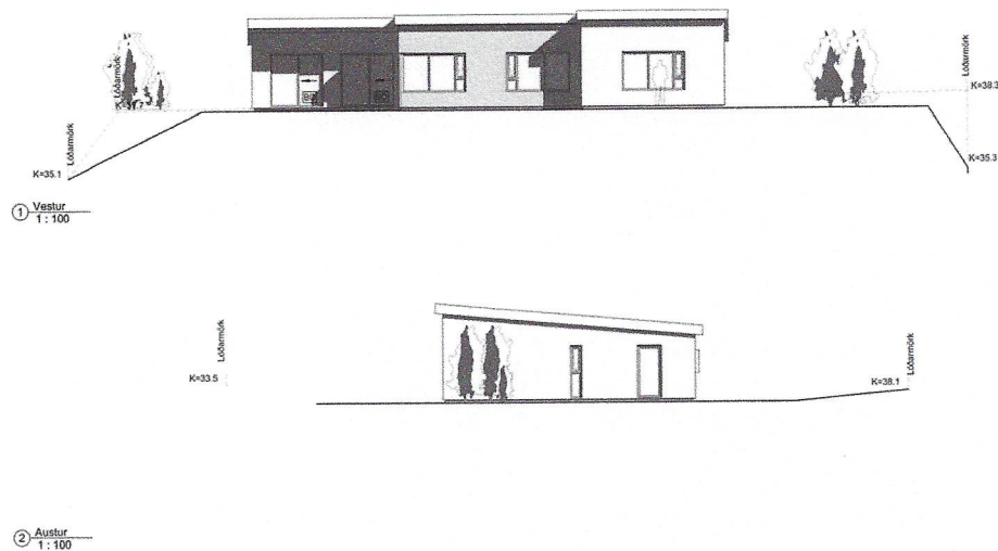
Mynd 4. Suðurhlið húss sem snýr að heimavist VA.