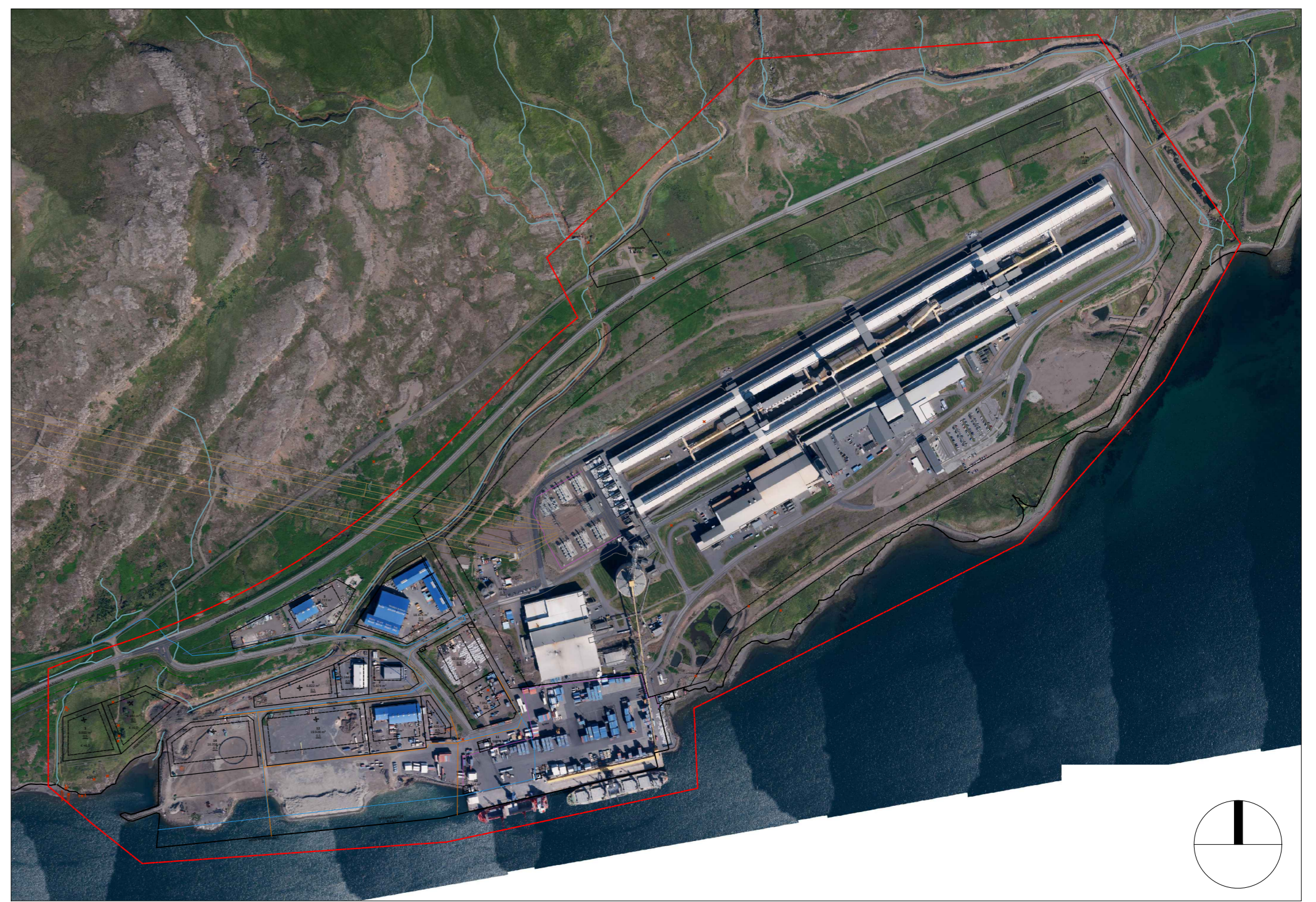
Skýringarmynd: Tillaga að deiliskipulagi Mjóeyrarhafnar í mkv. 1:9000.