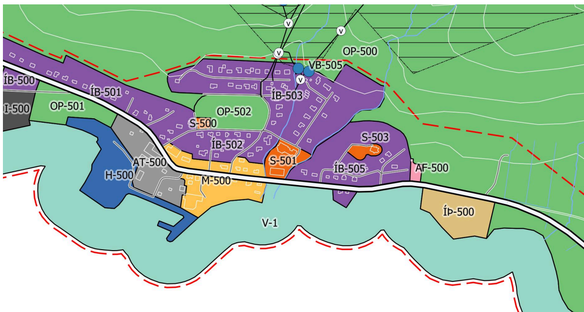
Hluti af aðalskipulagsuppdrætti fyrir Stöðvarfjörð, 1:10.000, eftir breytingu. Reitur AF-500 færir á austurjaðri byggðarinnar og OP-502 stækkar en OP-500 minnkar lítillega.