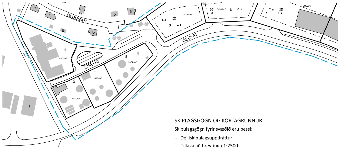
TILLAGA AÐ BREYTINGU 1:2500