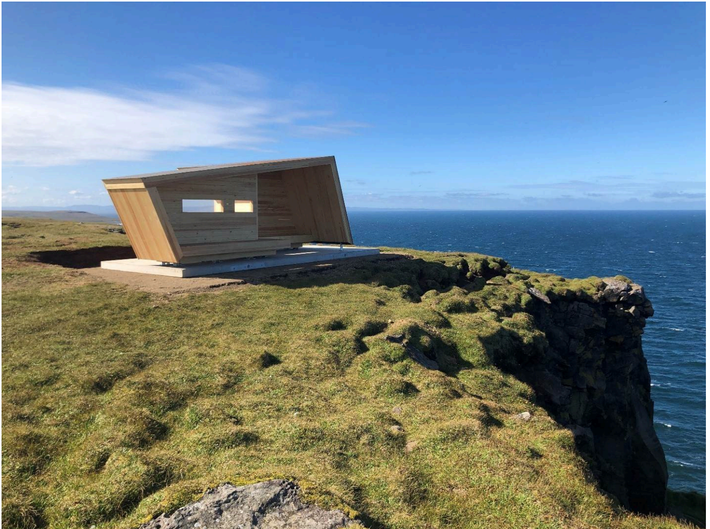
Mynd:Fuglaskoðunarskýli á Skoruvíkurbjargi.

„Framkvæmdasjóður ferðamannastaða hefur valdið straumhvörfum í uppbyggingu ferðamannastaða undanfarin ár. Frá árinu 2012 hafa yfir 900 verkefni hlotið styrk úr sjóðnum fyrir samtals 7,7 milljarða króna. Er hér um skynsamlegar fjárfestingar til lengri tíma að ræða, sem treysta undirstöður ferðapjónustunnar sem lykilatvinnugrein þegar kemur að verðmæta- og gjaldeyrissköpun fyrir þjóðarbúið,“ segir ráðherra.